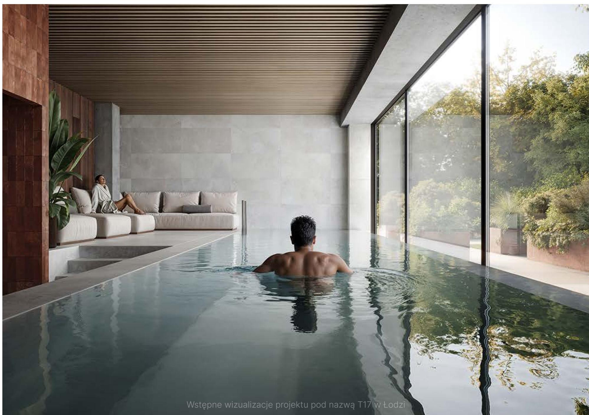
Wstępne wizualizacje projektu pod nazwą T17 w Łodzi