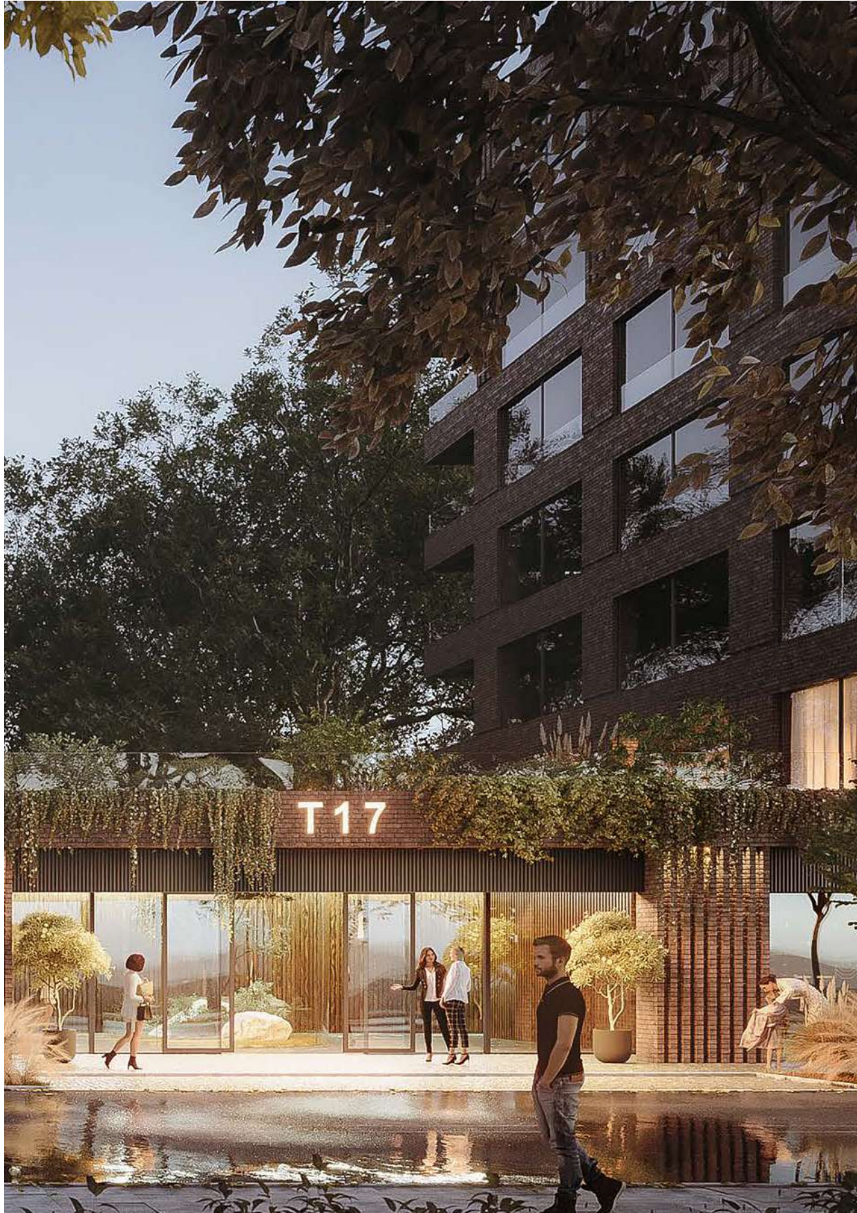
Wstępne wizualizacje projektu pod nazwą T17 w Łodzi